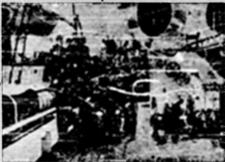
Grup pe crucișetorul «Elisabeta»