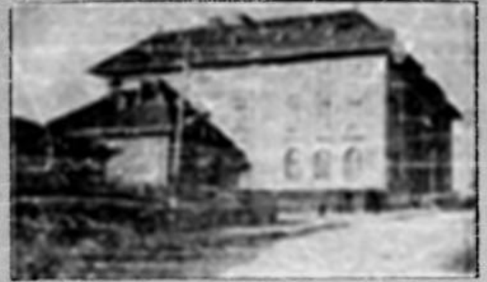
Școala No. 7