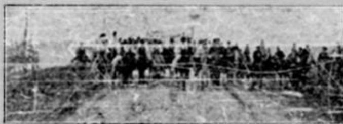
Convol de călăreți

altfel, cred că va veni prin încegerarea monumentului ce sete în care de executere în lăcaș Regimentului 34 Infanterie, din care batalionul de zăz sau a lăctat parte.